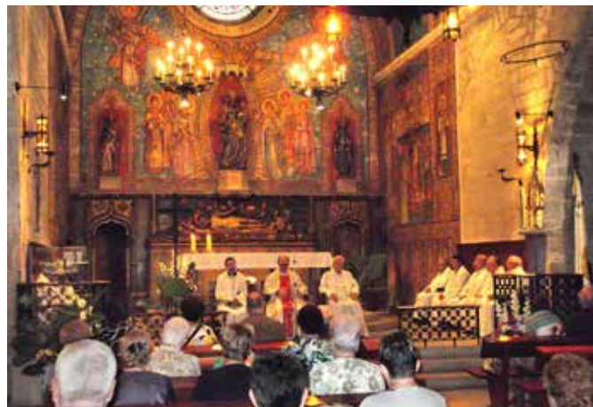
9 setembre. Parròquia i cor homes