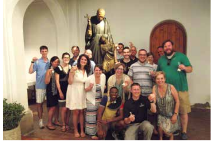
25 juny. Visita de un bon grup de filipins els quals tenien una gran devoció a St. Pere Claver