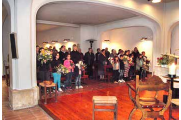
27 abril. Festa de la Verge de Montserrat, amb ofrena de flors a la Verge