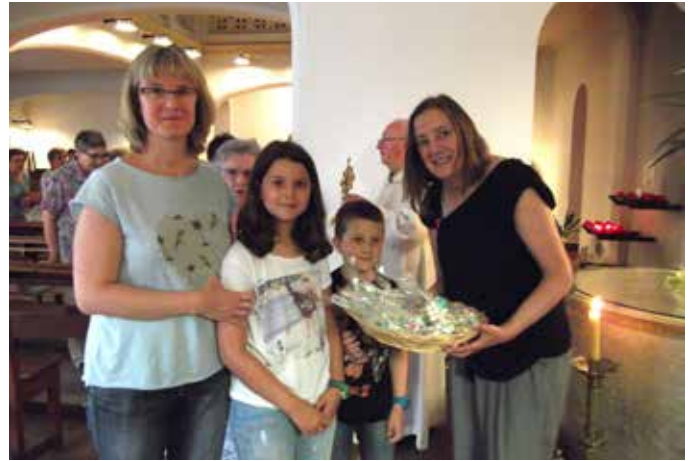
26 de juny. Celebració del 437è aniversari del Bateig de Sant Pere Claver